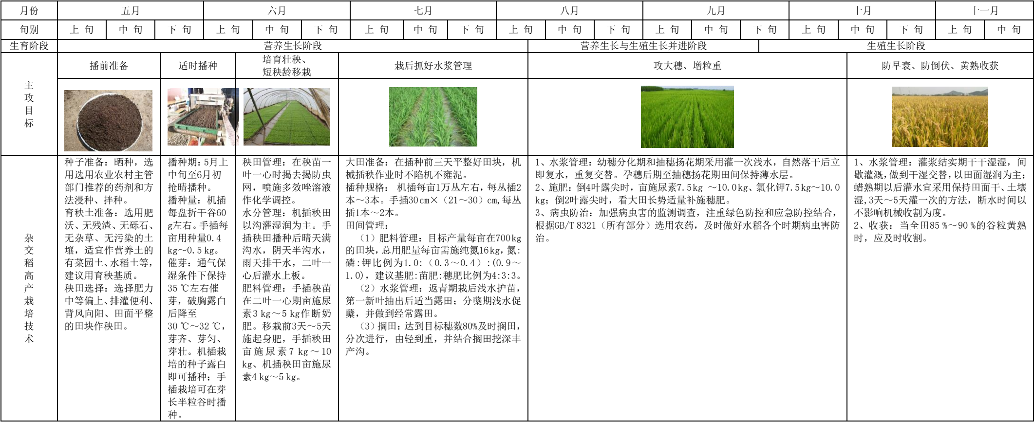
图A. 1 杂交稻高产栽培技术标准化模式图